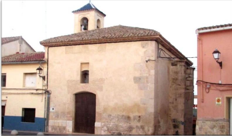
Oratorio de los Borja o Iglesia de la Torre situado en Canals