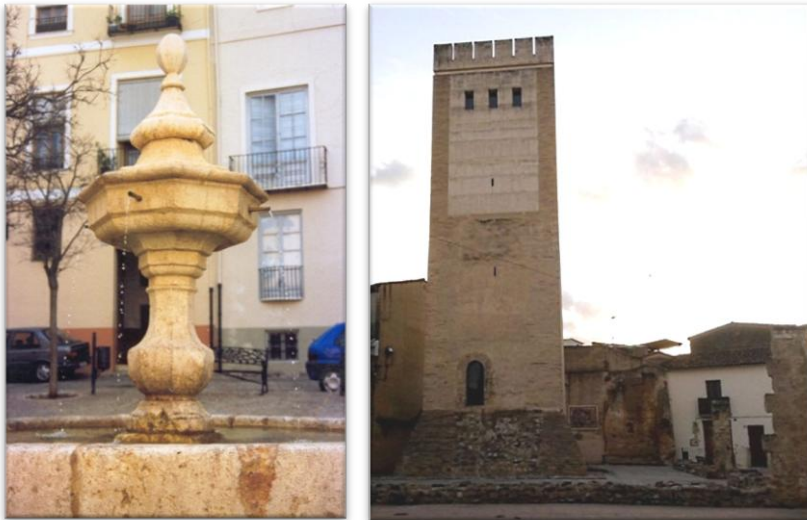
Plaza de Rodrigo Borja en Xàtiva y Torre de los Borja en Canals

un bastión realista durante la revuelta de la Unión contra Pedro el Ceremonioso. El apoyo demostrado por esta familia al Rey, en su lucha contra los Unionistas, en la expansión de Aragón hacia tierras Bizantinas y en la lucha sucesoria Castellana, en la que se posicionaron a favor de Enrique de Trastámara 2 , hizo que de igual forma que sucedió con otras familias, tras el conflicto, adquiriesen un rango nobiliario del que carecían en origen. A Gonçal le sucedió, en estas funciones, su hijo Rodrigo Gil de Borja , casado con Francesca de Fenollet, al que siguió su nieto, también llamado Rodrigo Gil de Borja al que llamaremos “menor” , que casó con Sibília Escrivá, y juntos adquirieron un mayor peso e importancia en el gobierno municipal de Xàtiva. Esta notoriedad llegó hasta el punto de que la plaza donde se encontraba la casa paterna acabó denominándose, aún hoy, plaza de Rodrigo de Borja.