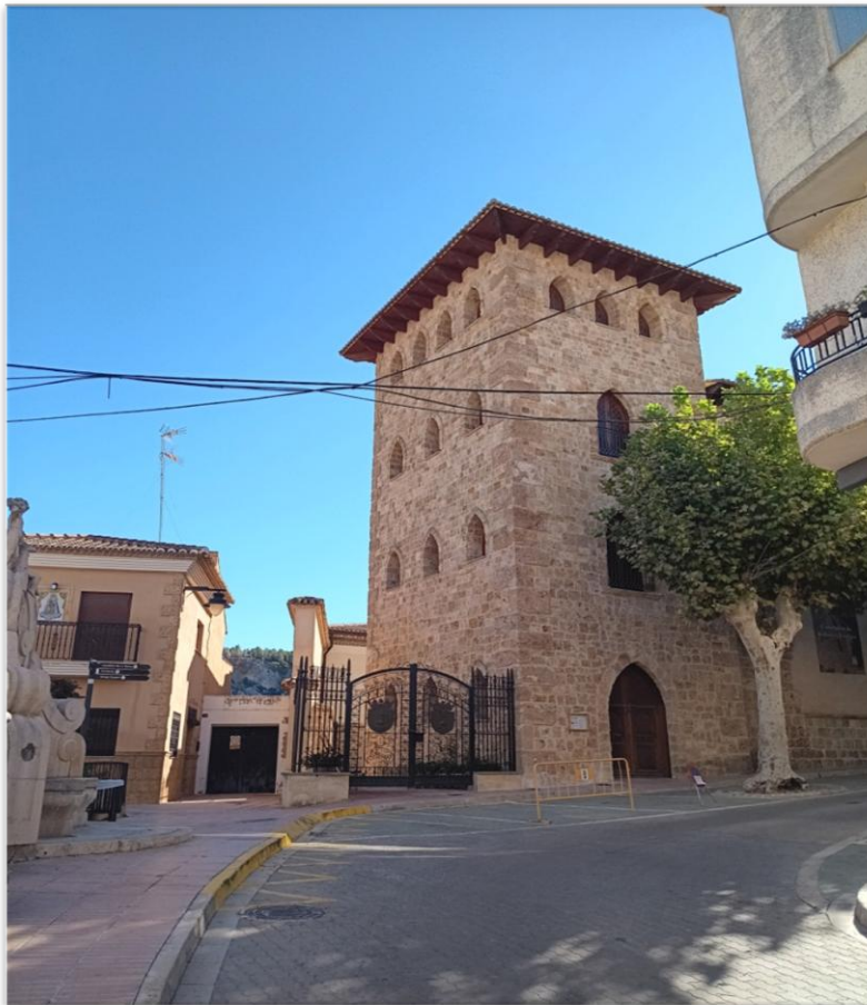
Vista de la casa palacio de los condes de Anna