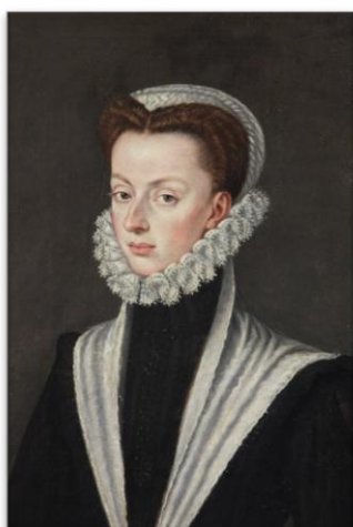
Juana de Austria