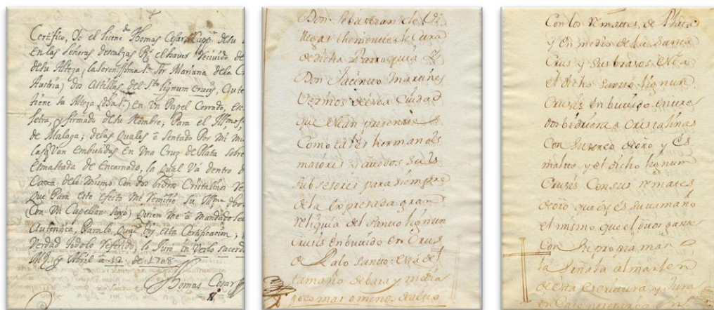
Libro de escrituras de la Cofradía del Santísimo Sacramento de la parroquia de San Juan Bautista

con dos vidrios cristalinos reviselados". Esta reliquia, bajo ciertas condiciones se depositará en la cofradía del Santísimo Sacramento de la iglesia parroquial del Señor San Juan Bautista de la ciudad de Málaga.