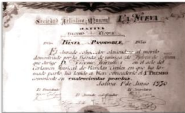
Diploma acreditativo del primer premio, año 1930.