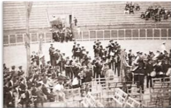
La Banda en el Certamen de la Feria de Xàtiva.